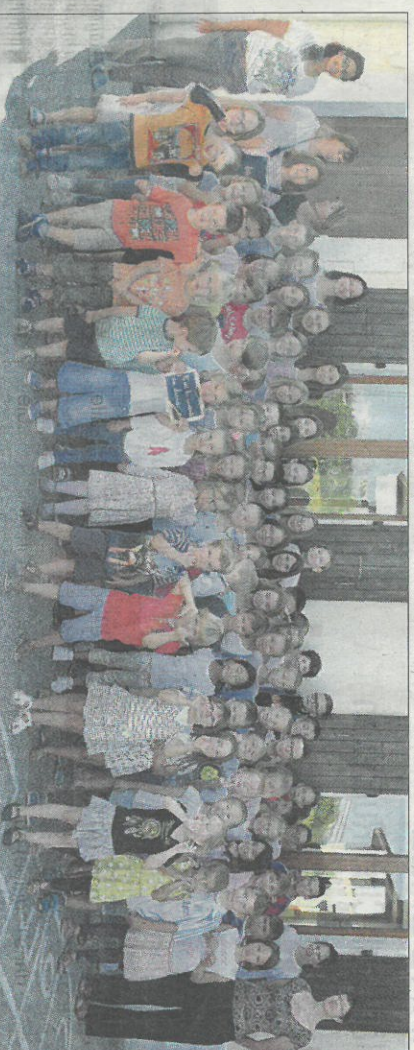
A l'école Léon Marie à Marcellaz-Albanais.