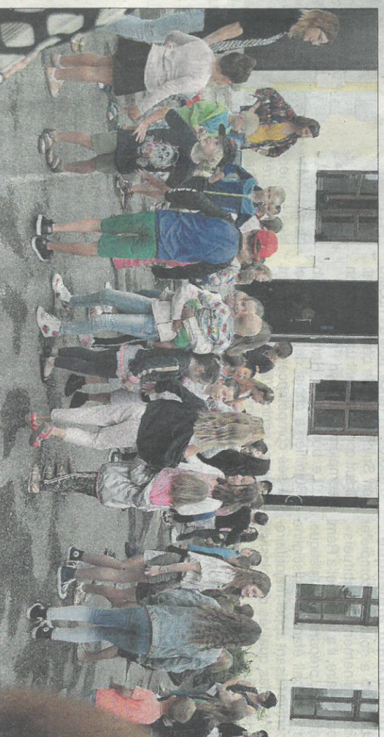
Une belle animation dans la cour de l'école de Saint-Eusèbe.

une coupure d'eau suite à une fuite. Mais rien de grave tout est rentré dans l'ordre avant la fin de la journée.